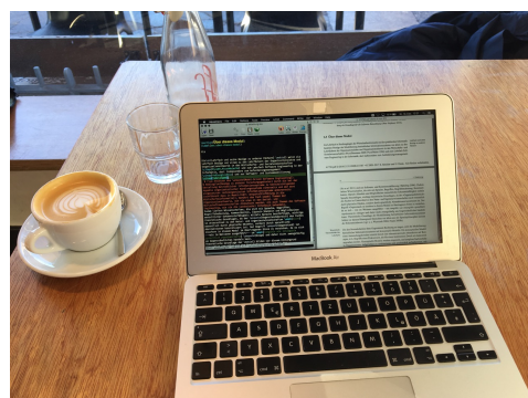
Abbildung 1.1: Impressionen wissenschaftlichen Arbeitens