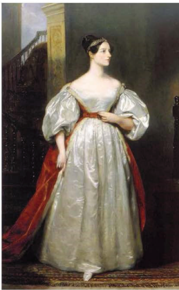
Abbildung 1.2: Ada Lovelace, die erste Softwareentwicklerin der Welt.

Ada Lovelace kommt schließlich das Verdienst zu, 1843 das erste Computerprogramm der Welt geschrieben zu haben, nämlich einen Algorithmus für die Berechnung der Bernoulli-Zahlen mithilfe eben jener Analytical Engine. Daher gilt Ada Lovelace auch als erste Softwareentwicklerin (noch vor dem ersten männlichen Entwickler), und die Programmiersprache Ada wurde nach ihr benannt (s. Abbildung 1.2). Die Programmiersprache der Analytical Engine kannte Schleifen und bedingte Verzweigungen. Die Analytical Engine war die erste Turing-vollständige 1 Rechenmaschine der Welt. Erst über 100 Jahre später im Jahr 1941 wurde mit der Zuse Z3 der erste funktionsfähige Turing-vollständige Computer auch gebaut. Die für die Analytical Engine geplante Genauigkeit von 50 Dezimalstellen wurde erst 1960 erreicht.