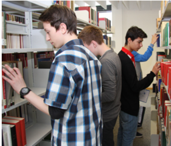
Die Jungen war beim Boys' Day in der Universitätsbibliothek.